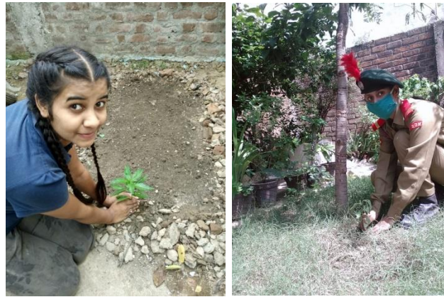
Plantation Activity on Plantation Fortnight