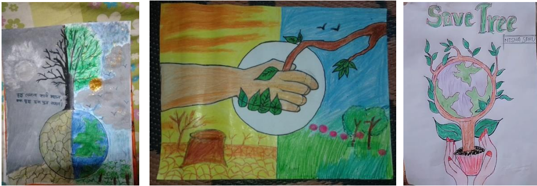
Poster competition on World Environment Day