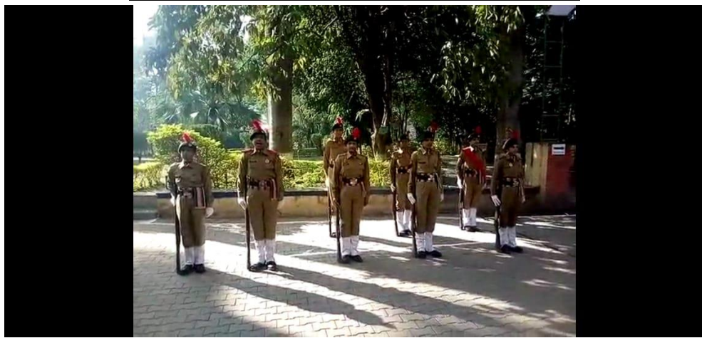
Guard of Honor