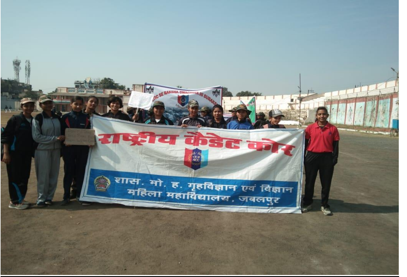
यातायात महासंकल्प रैली