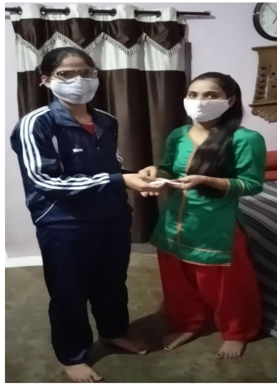
Mask Making and Distribution Activity